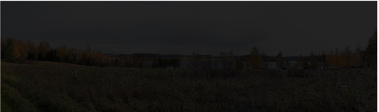
Kuva 3. Havainnekuva kuvauspisteestä 4. Lapinlahdelta pimeään aikana.