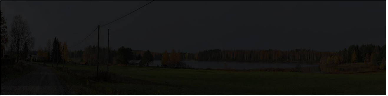
Kuva 2. Havainnekuva kuvauspisteestä 3. Urimolahdelta pimeään aikana. Kuvan on toteuttanut Etha Wind Oy.