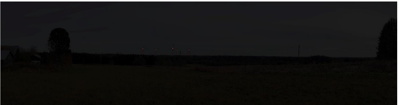
Kuva 4. Havainnekuva kuvauspisteestä 10. Koskutmäestä pimeään aikana.