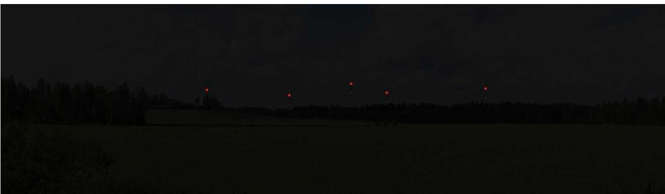
Kuva 5. Havainnekuva kuvauspisteestä 18. Suurimäestä pimeään aikana.